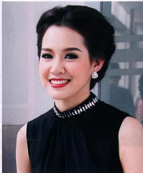
แต่งหน้า - กำแพงเงินป่า IG : @makeupbylek_l, เลอเนด้า - กำแพงเงินป่า FB: เลอเนด้า, งามงาม สัตยภิญโญ

ถ้าเจ้านายกอดอก บิดตัวไปทางอื่น หรือยังไม่มีการเปิดใจฟังคุณ ให้ชวนคุยหรือปรึกษาหรือเรื่องอื่นไปก่อน กระทั่งเขาปล่อยแขนอย่างผ่อนคลาย นิ้วมิตัวเข้าหาคุณ หรือหันมาฟังสิ่งที่你说อย่างตั้งใจ ให้ช่วยจังหวะนี้เจรจาขอสิ่งที่คุณต้องการทันที เพราะนั่นเป็นสัญญาณว่าเขาเริ่มเปิดใจให้คุณแล้ว